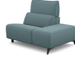
IS00R (100 cm x 91 cm x 134 cm)