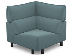
EK01 (100 cm x 95 cm x 100 cm)