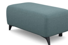
P010L/P010R (48 cm x 45 cm x 100 cm)