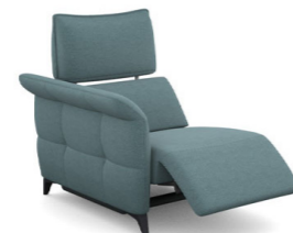
B100EL (86 cm x 95 cm x 100 cm)