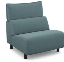
E150 (86 cm x 95 cm x 100 cm)