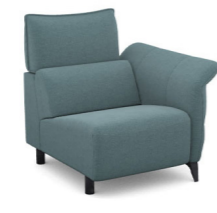
B100R (86 cm x 95 cm x 100 cm)