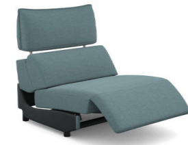
E150EL (86 cm x 95 cm x 100 cm)