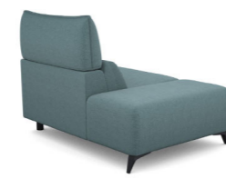
IS00L (100 cm x 95 cm x 134 cm)