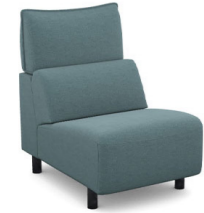
E100 (65 cm x 95 cm x 100 cm)