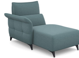
CH00L (100 cm x 95 cm x 160 cm)