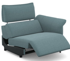
B150ER (107 cm x 95 cm x 100 cm)