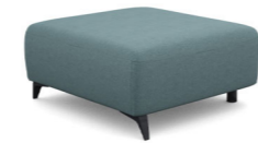
P000L/P000R (88 cm x 45 cm x 100 cm)