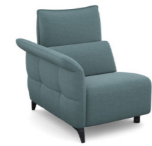
B100L (86 cm x 95 cm x 100 cm)