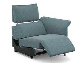
B100ER (86 cm x 95 cm x 100 cm)