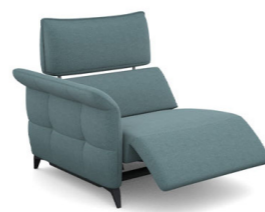
B150EL (107 cm x 95 cm x 100 cm)