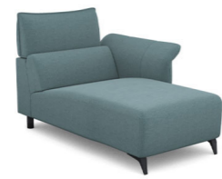
CH00R (100 cm x 95 cm x 160 cm)